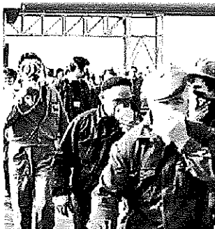
Allarme per una fuga di gas (1976)

di indicare l'autore. In ogni caso di serve una descrizione con alcuni dati essenziali, come la data e il luogo della fotografia. Quante più indicazioni saranno fornite, tanto più il nostro foto album sarà completo. Chiediamo di aiutarci soprattutto a chi ogni giorno varcava (e forse ancora oggi lo fa) i cancelli degli stabilimenti. Immagini tirate fuori da vecchi album, dai cassette. Di lotte sindacali, ma anche di catene di montaggio. Di momenti di socialità, di amicizie cementate dal lavoro nelle fabbriche di Porto Marghera.