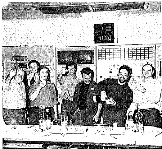
Anni Ottanta, momento di festa tra colleghi